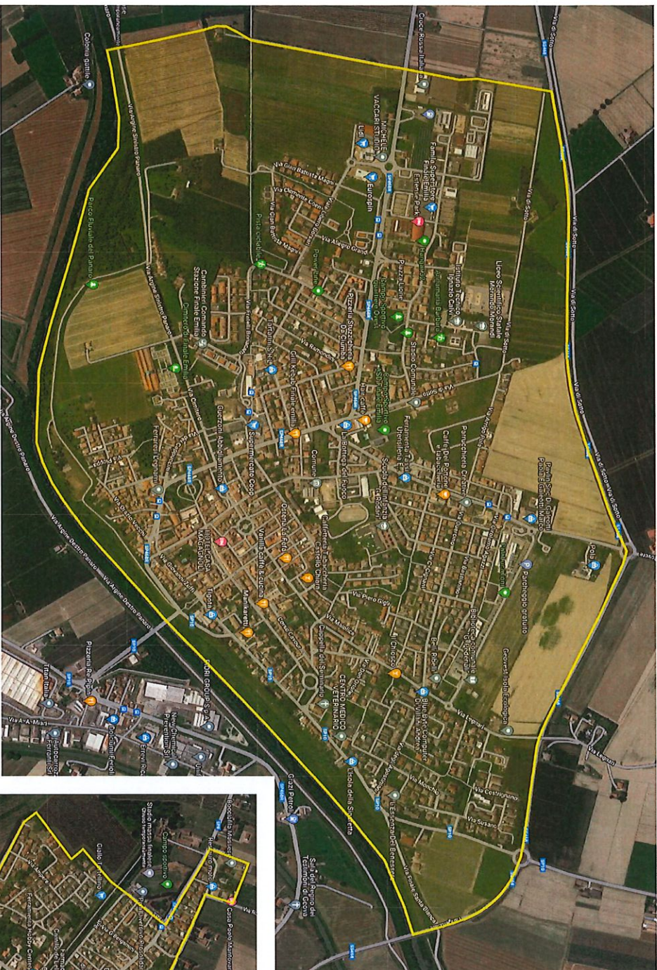
COMUNE DI FINALE EMILIA

(firmato il 14.12.2023, depositato il 19.12.2023, con decorrenza 01.01.2024)